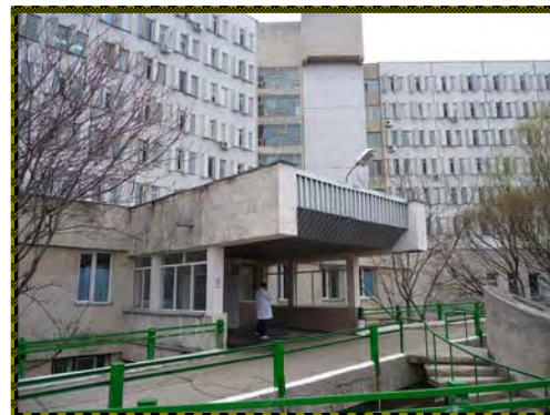
Center of Medicină De Urgență