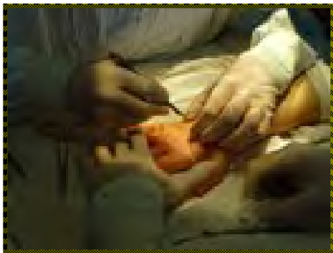
Surgical correction of Dupuytren's contracture

I soon learned that medicine was limited by expensive diagnostic tests and a far from comprehensive medication list available through the government formulary. Only the basic diagnostic analyses were funded by the centralized government insurance (to which most working class citizens belong), with any excess workup requiring individualized payment. Nevertheless, I found that every one of the physicians I met was especially attentive to their patients. Protocols, although they exist, were never an automated treatment plan – rather a guideline that every physician considered in the individualized workup and treatment of every patient. Overall, hindered by limited supply and funding – the Moldovan medical system is built on providing the best possible secondary and tertiary care to its citizens, and with its caring and hard-working physicians, I hope that the future brings a stronger economy with improved resources, raising the medical system to its full potential, built on a dedicated, hard-working class of physicians, nurses and health care employees.